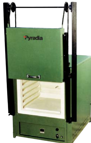
Boîtier acier fini émail, avec porte standard à ouverture horizontale